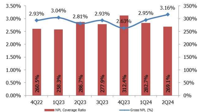
CHART 2: NPL coverage ratio and gross NPLs

บริษัทหลักทรัพย์ ทรินิตี้ จำกัด เลขที่ 1 อาคารพาร์ค สยาม ชั้น 22 และห้อง 2301 ชั้น 23 ถนนคอนแวนต์ แขวงสีลม เขตบางรัก กรุงเทพฯ 10500